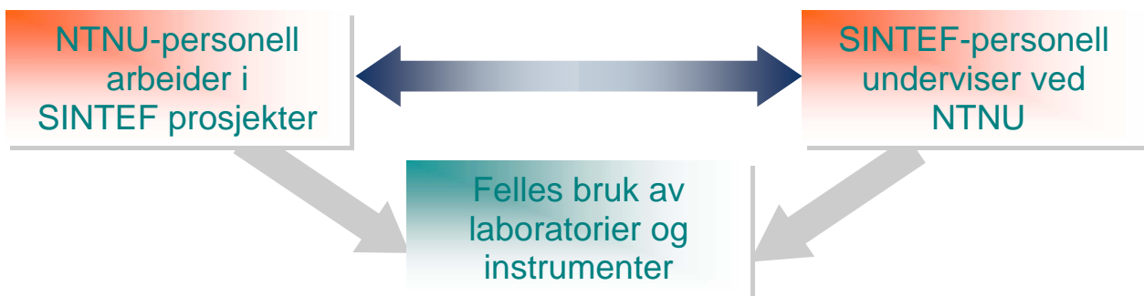
Figur 1. Modell for samarbeid mellom NTNU og SINTEF

Formålet med samarbeidet om Gemini-senteret er å bygge større fagmiljøer med høyere kvalitet enn partene vil klare hver for seg. Gjennom felles strategiprosesser og et tett arbeidsfellesskap, skal vi kunne gripe og realisere nye muligheter, og dermed øke verdiskapingen og bedre lønnsomheten for den felles virksomhet.