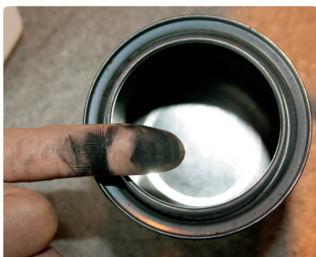
Fig. 1. Under testing ved SINTEF NBL, ble det dannet avsetninger av sot/partikler på brennerskålen.

Hele rapporten for etanolpeiser kan lastes ned på www.sintef.no/byggforsk/sintef-nbl-as/ .